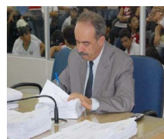
Vereador avalia que projeto para reajustar salário dos servidores de CG apresenta falhas