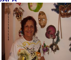
34ª edição do Festival de Inverno de CG terá início próxima sexta