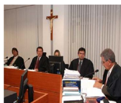
Pleno instaura procedimento disciplinar e afasta juiz da 5ª Vara de CG