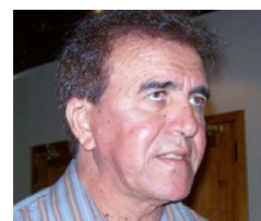
Presidente da Famup faz balanço da mobilização dos prefeitos em Brasília